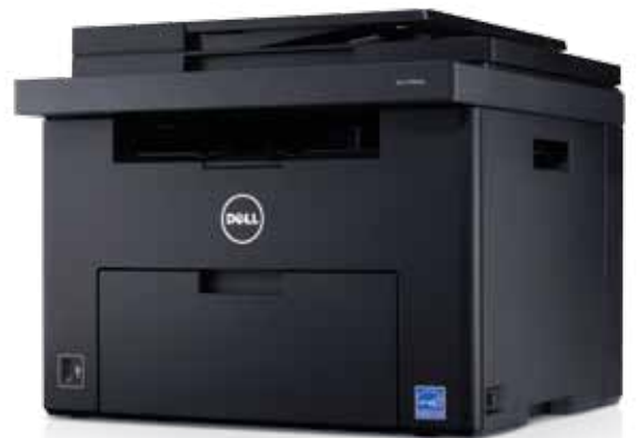
Impresoras multifunción a color Dell™ C1765nf y C1765nfw

1. El PC debe contar con una tarjeta inalámbrica, estar conectado a una red inalámbrica y tener el software de la impresora instalado para que funcione correctamente.