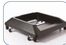
Plataforma estabilizadora (SB-7100) Recomendada cuando se instalan 2 o más bandejas opcionales para incrementar la estabilidad