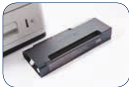
Cartucho de tinta (HC-05BK) Aprox. 30.000 páginas 1