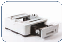
Bandeja inferior opcional (LT-7100) Hasta 500 hojas (máximo 3)