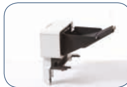
Apilador de salida (MX-7100) Hasta 500 hojas (máximo 1)